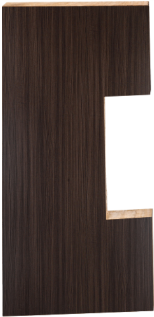
दरवाजा लेमिनेट के साथ